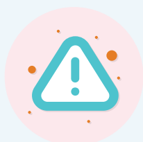
敏感及藥物 不良反應