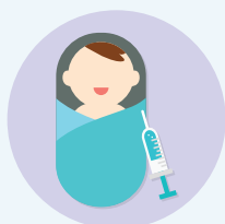
出生及防疫 接種紀錄