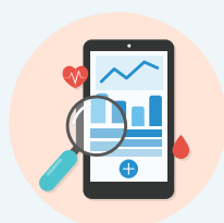
觀察及 生活方式紀錄