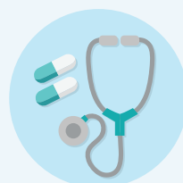
診斷、手術及 其他醫療程序、藥物