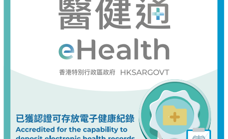
醫務化驗中心認證標誌