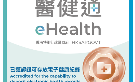
放射診斷中心認證標誌